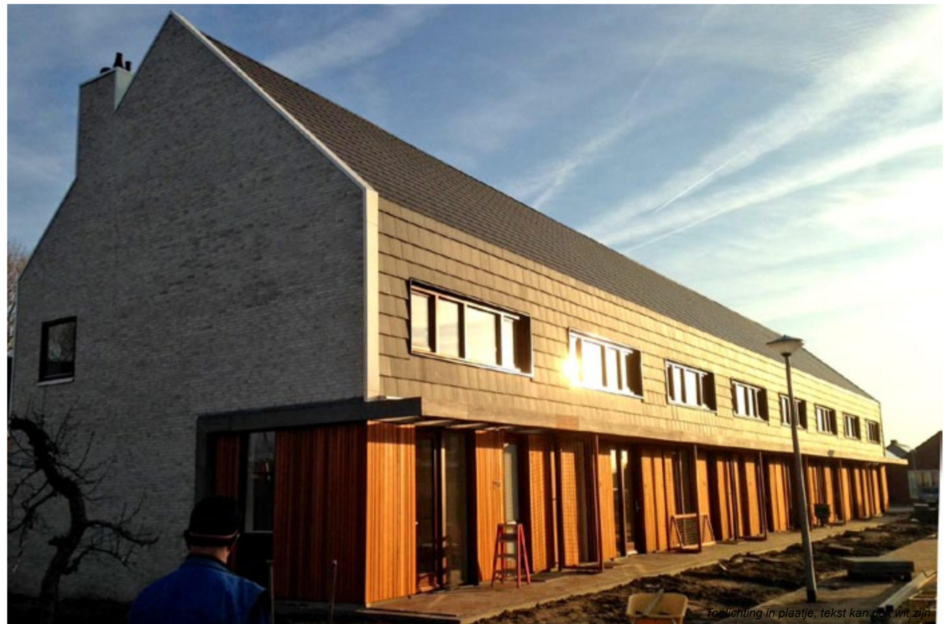
Toelichting in plaatje, tekst kan ook wit zijn