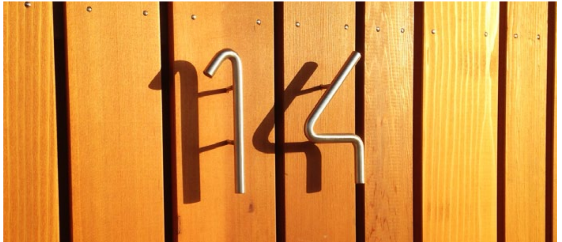
Detailering van het abstracte hoofdvolume en een warme verblijfsplek

type woningbouw conceptwoningen programma 12 eengezinswoningen opdrachtgever Wooncompagnie status gerealiseerd 2016